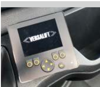
Kezelőbarát kijelző a fülkében