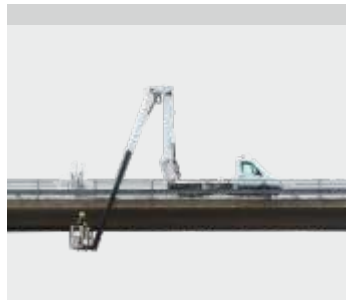
Lehetséges talajszint alatti munkavégzés (-3,3 m)