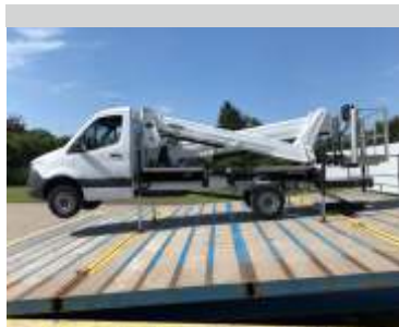
6° szintezés a jármű helyzetétől függően