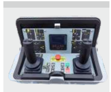
FPC (Arányos CANbus) Változó kinyúlás, 4 művelet egyidejű működése és HAZA funkció